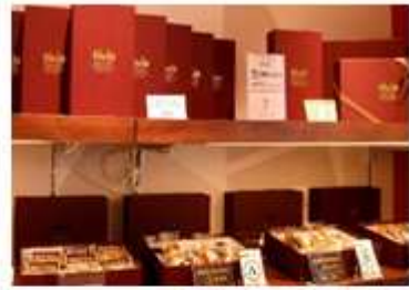
手張りのギフトボックス