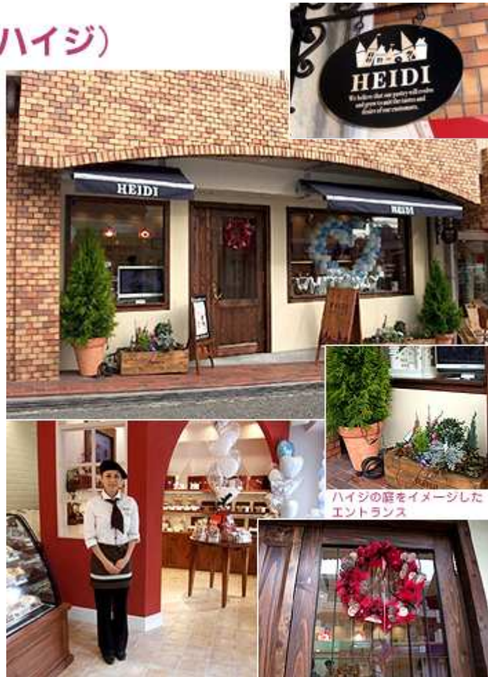
ハイジの庭をイメージした エントランス