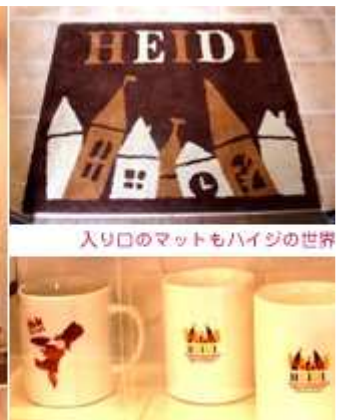
入り口のマットもハイジの世界