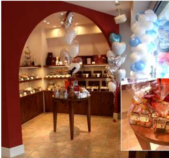
赤いアーチの先に広がる焼き菓子コーナー