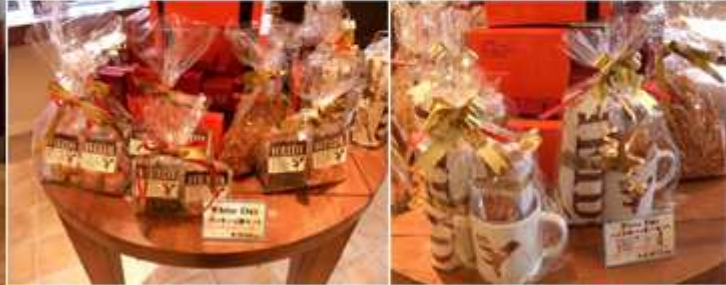
プチギフトも充実

ホワイトデー直前とあって、ホワイトデー向けの商品が提案されていました。本格ギフト向けのボックスは職人の手張り。せっかくのギフトなので一回で捨てて欲しくないとの思いから、手張りにこだわったとのこと。また日常のプチギフトとして、2個、3個でも可愛いくラッピングしてくれます。そのちょっとしたアイデアがファンを呼び込んでいるのです。