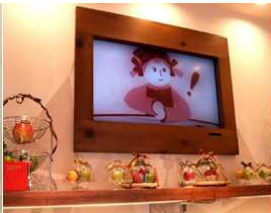
ビデオで常時ハイジの物語が見られる