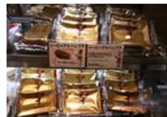
蘇ったアルハンブラが買える

このHEIDIに生まれ変わって登場した『アルハンブラ』は、素材も吟味、卓越した職人さんの思いがこもった自慢の逸品。「HEIDIの看板商品アルハンブラはそのまま食べてもよし、冷凍すればチョコアイスのような味わいと楽しみ方をご提案、お客さまに喜ばれています。