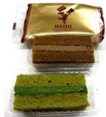
チョコとスポンジの味が絶品のアルハンブラ